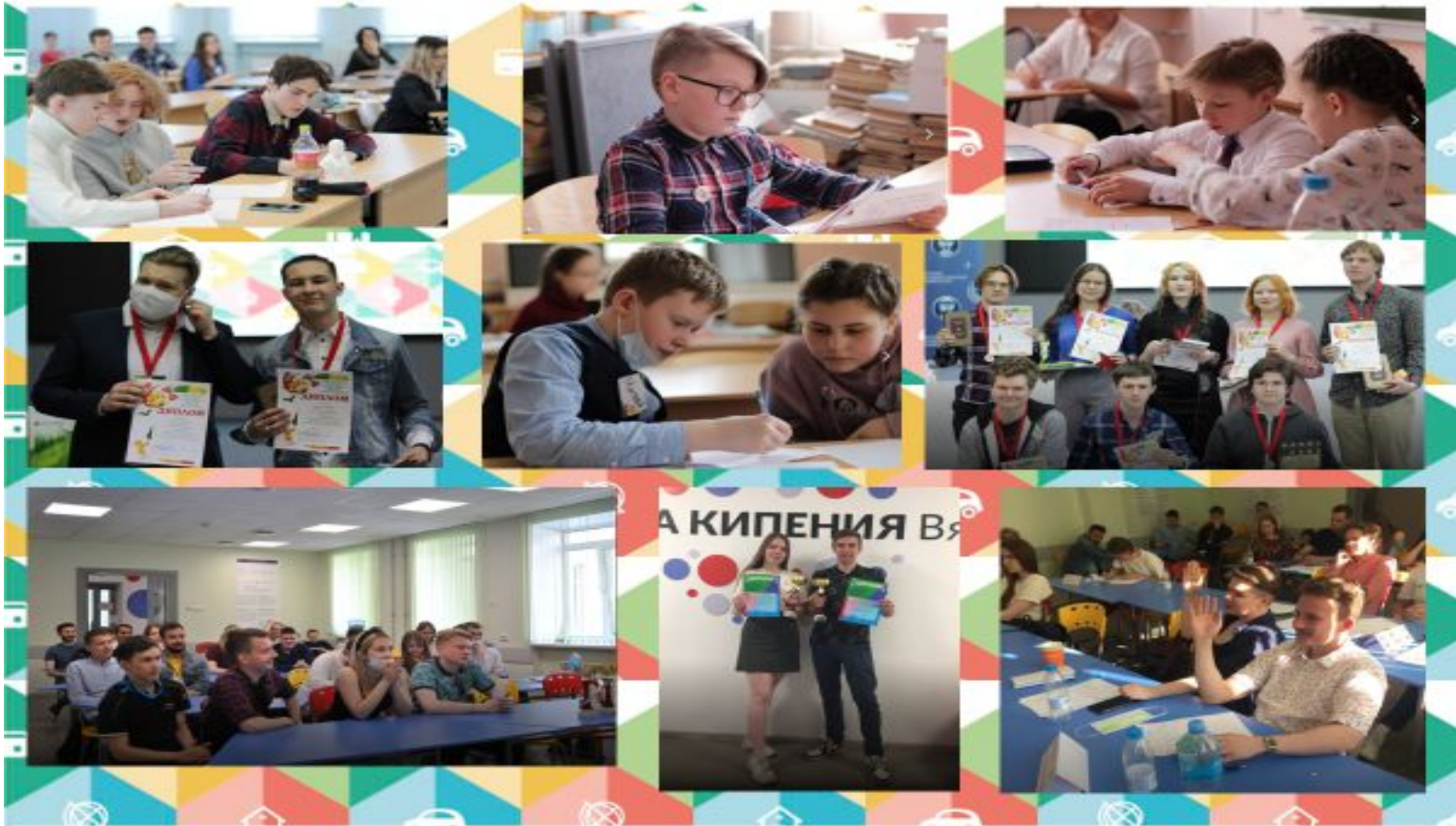
Discover the world of debate