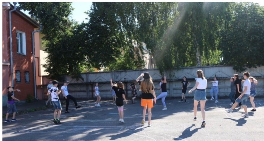
Площадка для спортивных и игровых мероприятий