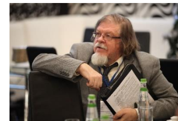
В.В.Рубцов академик РАО