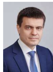
Президент России Путин В.В.

Учитывая большой запрос на открытость власти, ключевым принципом при формировании приоритетов бюджетной политики будет человекоцентричность – внимание к мнению жителей края ... Настаиваю на расширении инициативного бюджетирования