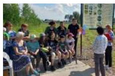
Проект «LED-солнце» Пировская средняя школа