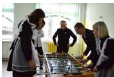
Проект «Зона комфорта» Пировская средняя школа Пировский округ