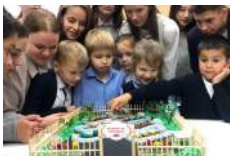
Проект «Станция Утиная» Мокрушенский сельсовет Казачинского района