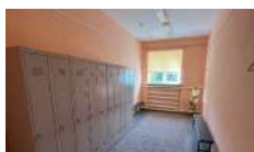
Проект «Раздевалка 3:0» Кириковская средняя школа Пировский округ