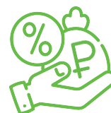
Займ / Микрозайм