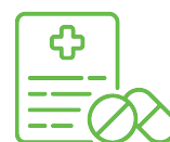
Кредит на лечение