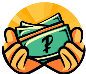
Перехвати До Получки