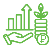
Кредит на бизнес