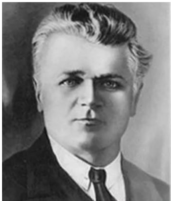
Шацкий Станислав Теофилович