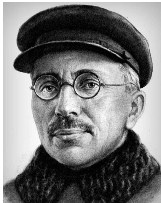
Макаренко Антон Семенович